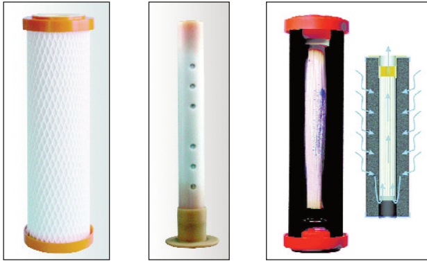
Bild links: Filtration mit dem außenliegenden Aktivkohle-Vorfilter. Durchflussmenge: 4 – 8 Liter pro Minute je nach Leitungsdruk.

Eine neuartige Kombination von zwei bewährten Technologien