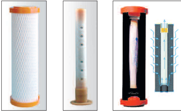
Bild links: Filtration mit dem außenliegenden Aktivkohle-Vorfilter. Durchflussmenge: 4 – 8 Liter pro Minute je nach Leitungsdruk.

Eine neuartige Kombination von zwei bewährten Technologien